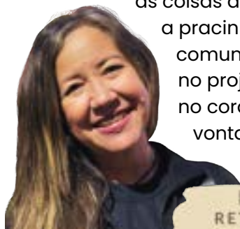
Pati Mont Mor RETIRO COLONIAL

A gente continua sonhando que vai dar certo, estamos na expectativa de ver as coisas acontecendo. Ver a pracinha linda na minha comunidade, como vi no projeto, reacende no coração da gente a vontade de ver as coisas funcionando.