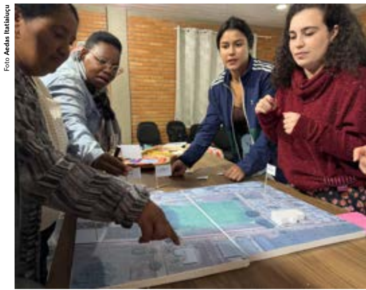
Mulheres em oficina sobre Reparação Coletiva.