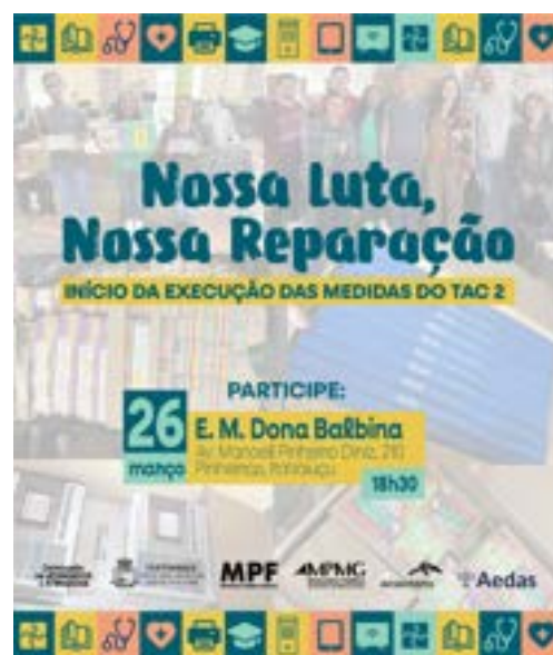
Card de divulgação do evento.

Quais são os equipamentos? Equipamentos para salas de recursos multifuncionais (ex. tablets, microcomputadores, scanners, jogos educativos e outros materiais); modernização de duas unidades de saúde da família (USFs): Pinheiros e Vieiras (ex. armários, cama hospitalar, macas, e outros equipamentos); instalação de equipamentos audiovisuais para salas de aula do município (ex. smart TVs, lousas digitais, equipamentos de áudio e outros materiais).