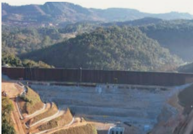
Estrutura de Contenção a Jusante (ECJ)

Segundo o relatório, os níveis de água permanecem normais para o período